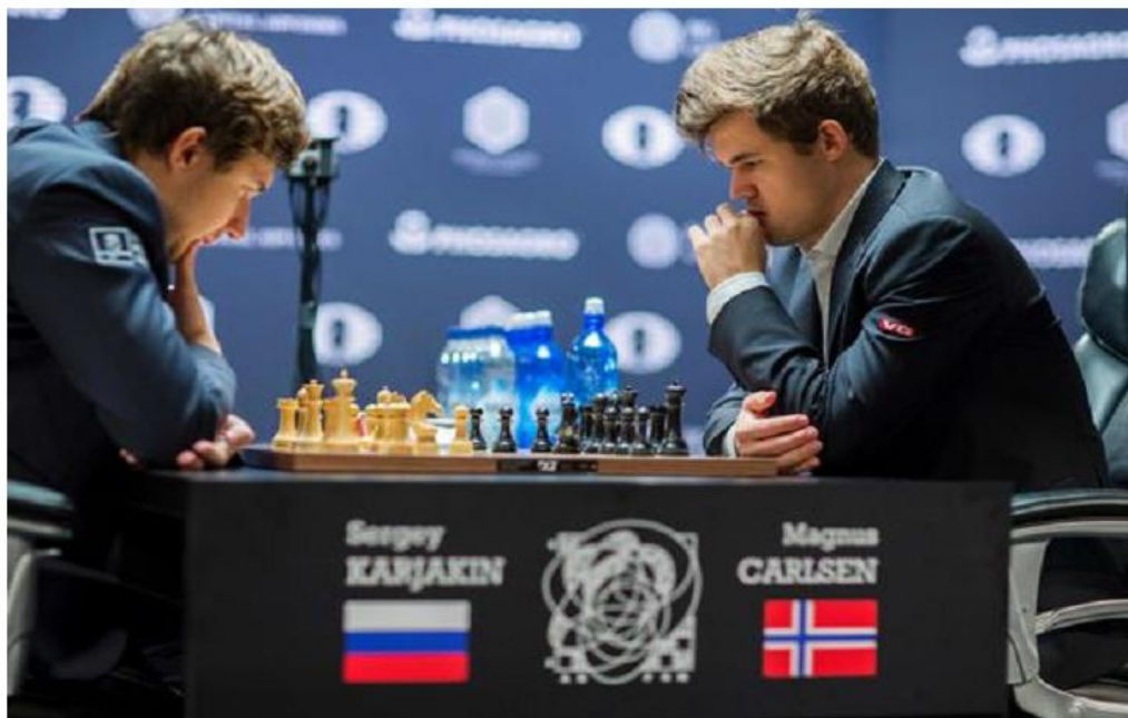
Magnus Carlsen (à droite) lors du championnat du monde d'échecs, face au Russe Sergueï Kariakine.

LE MONDE | 01.12.2016 à 00h55 • Mis à jour le 01.12.2016 à 09h31 | Par Pierre Barthélémy (journaliste/pierre-barthelemy/)