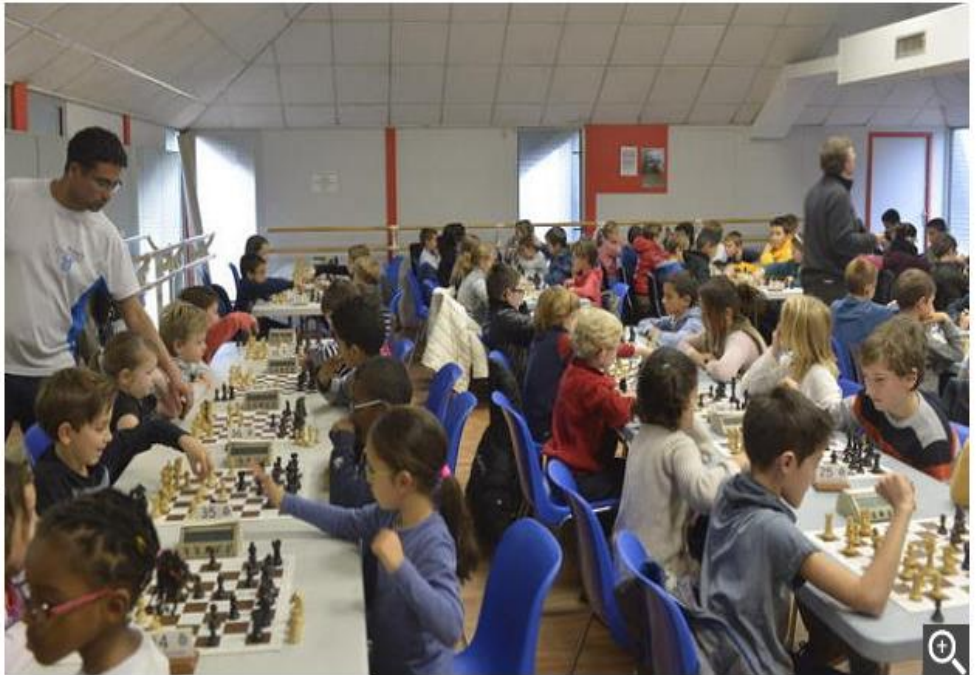
Les joueurs s'affrontent lors du tournoi de Noël.

Les joueurs du club vont maintenant pour certains jouer les tournois de Noël ou tout simplement se reposer pour les fêtes.