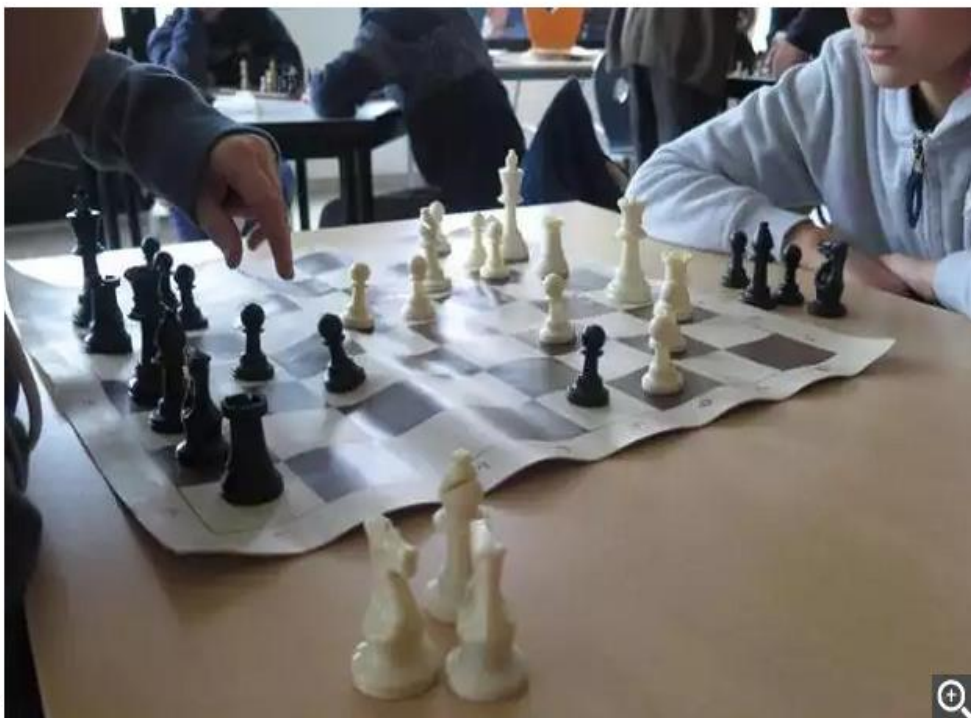
Vendredi, au collège Malraux : concentration et application, lors de l'atelier animé par le club d'échecs Les Tours d'Amboise. Des cycles de six semaines sont également proposés aux élèves de CM1, dans le cadre des temps d'accueil périscolaires.