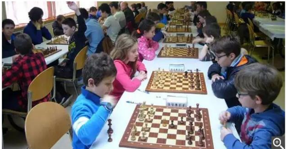
A tout niveau, encore une réussite pour l'échiquier corpopétrussien.